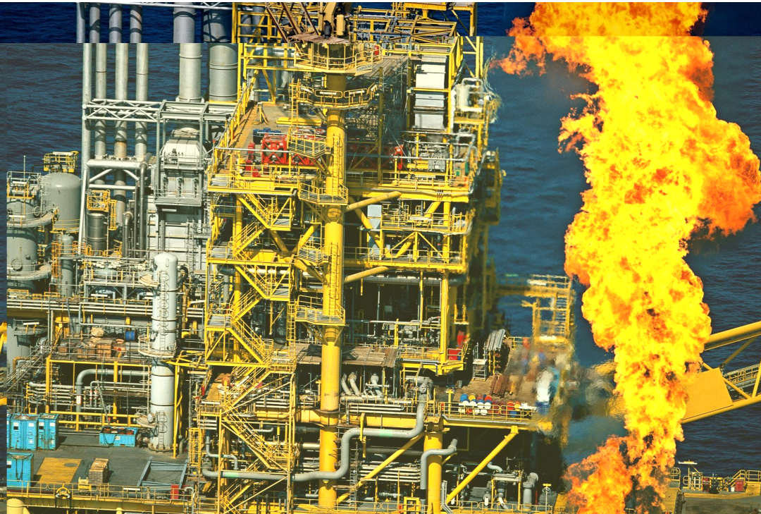
Plate-forme pétrolière d'Al-Shaheen au Qatar

Le pétrole est le « roi des énergies fossiles ». Facile à extraire et à utiliser, il accompagne les hommes partout dans le monde depuis 150 ans, que ce soit dans les transports ou dans les champs. Mais on sait désormais que c'est l'un des premiers responsables du changement climatique. Il doit céder la place à d'autres énergies.