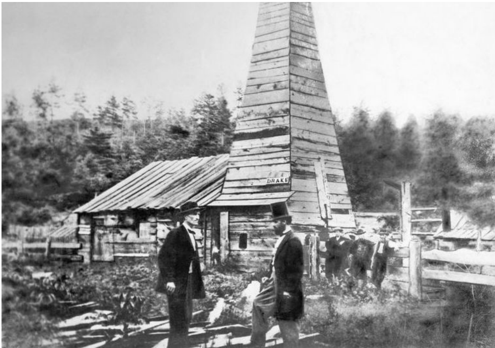
Le faux "colonel" Edwin Drake devant le puits de pétrole qu'il a découvert en Pennsylvanie en 1859.

Le pétrole était déjà utilisé il y a 5 000 ans en Mésopotamie, mais c'est le forage en 1859 du premier puits de pétrole en Pennsylvanie , un État de l'Est des États-Unis, qui a signé la naissance de l'industrie pétrolière. Edwin Drake , qui pour épater la galerie se faisait passer pour un colonel de l'armée américaine, réussit alors l'exploit de forer à 21 mètres de profondeur. Dix ans après la fameuse Ruée vers l'Or de Californie débutait la Ruée vers l'Or noir .