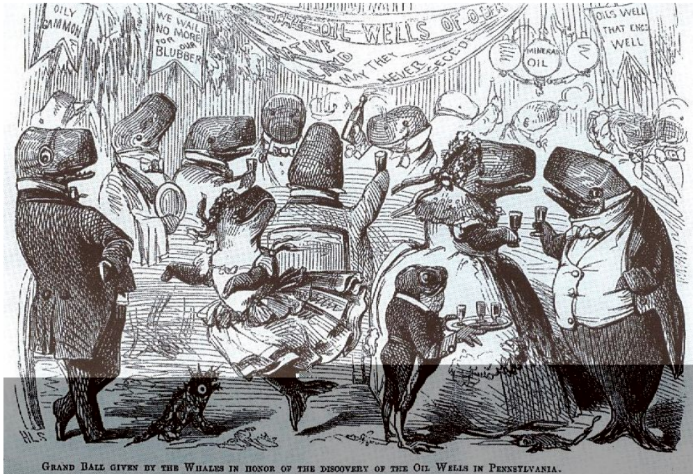
« Le Grand Bal des baleines ». Dessin paru en 1861 dans le journal Vanity Fair . Des cachalots en habit de soirée dansent et trinquent à la découverte de puits de pétrole en Pennsylvanie.